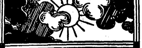
Barometer daalt langzaam

Aanvankelijk is in dezen toestand weinig verandering te wachten.